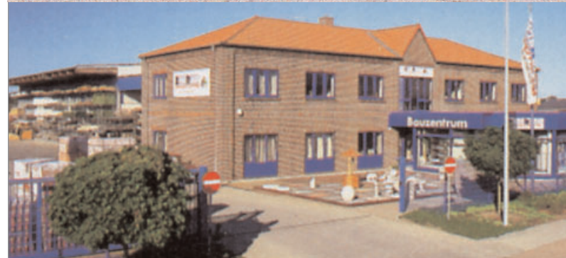
Grevesmühlen Langer Steinschlag 2005 (o.) Parchim 2005 (u.)

(Dies Motiv fehlte bei den u. Kd. gelieferten Bilddaten – Hier nur Grobscan von Kopie)