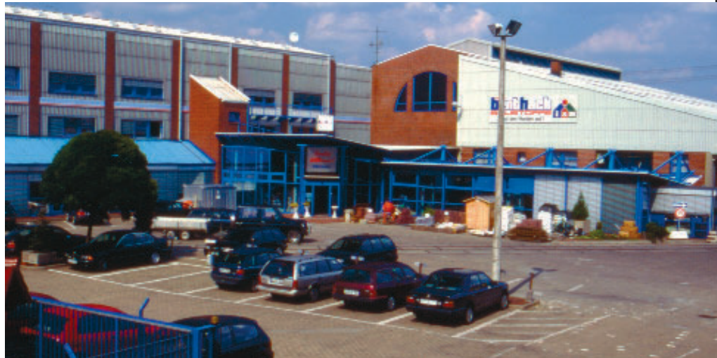
Hamburg Bredowstr. 2000

keiten im Bereich Einkauf nahe. Das Ergebnis war der Eintritt in die Baustoffhandelskooperation Interpares in Karlsruhe mit dem Zentrallager in Sittensen. Diese Entscheidung hat sich für das Unternehmen in den Bereichen Einkauf, Logistik und EDV als sehr erfolgreich erwiesen. Heute hat sich durch 2 Fusionen aus der INTERPARES die i & M INTER-BAUSTOFF entwickelt.