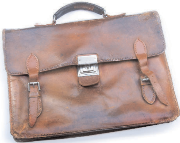
Kisuaeli Neumix kaderfüff