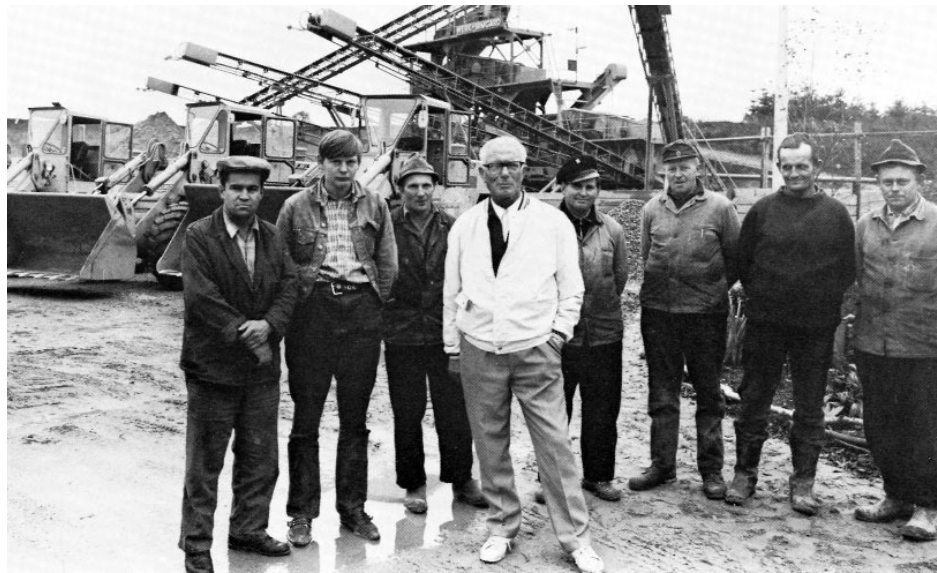
Kieswerk Groß Vollstedt

Dafür entwickelte sich die Niederlassung Neumünster nach einer schwierigen Anlaufphase hervorragend. Es war nicht so leicht, sich als “Neuer“ gegen einen seit über 100 Jahren am Ort ansässigen Kollegen durchzusetzen.