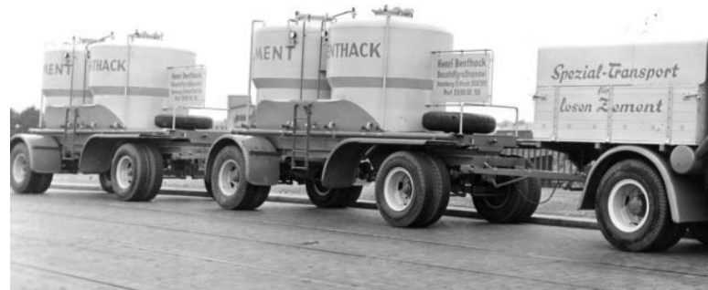
Der erste Silozement-Lastzug