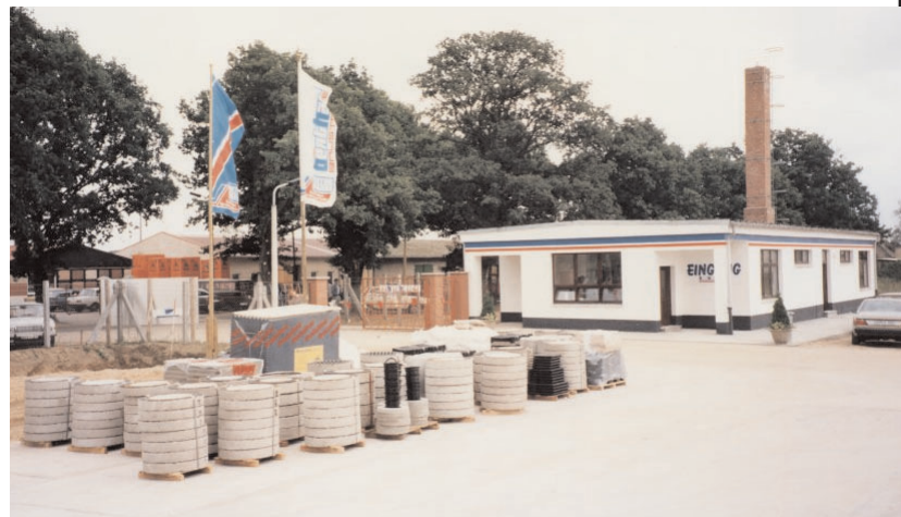
Der Anfang in Parchim, Möderitzer Weg 1990